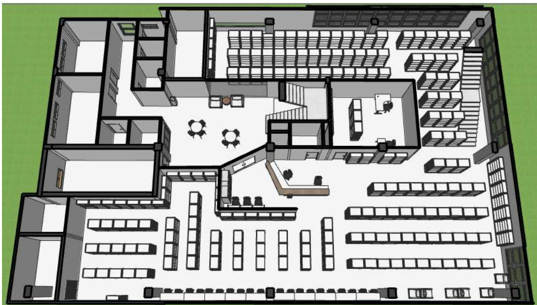
Figura 05 - Modelagem 3D do segundo pavimento

A situação desses pavimentos é similar à dos demais pavimentos da edificação. Os serviços executados são os mesmos realizados no pavimento térreo, com exceção dos painéis de vidro temperado, que não foram instalados nas outras áreas da edificação e as esquadrias foram instaladas normalmente, sem a necessidade de demolir alvenarias no perímetro.