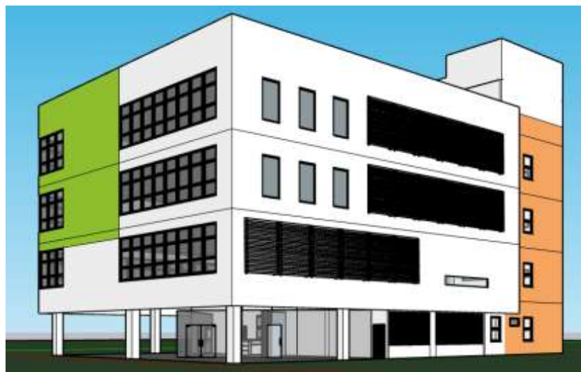
Figura 01 – Modelagem 3D da edificação.

O edifício será a nova sede da biblioteca Isaías Alves da Faculdade de Filosofia e Ciências Humanas, recebendo deslocamento da localidade onde atualmente funciona contendo aproximadamente 230.000 (duzentos e trinta mil) volumes, entre livros (alguns dos quais raros e de acervos especiais), teses, dissertações acadêmicas e periódicos. A figura 01 a seguir ilustra a modelagem 3D da edificação e a figura 02 o mapa de localização da biblioteca constante na prancha BIBFFC15C-AR-PE-01-IMPLANTACAO-R02_URBANIZACAO, desenho contido no Apêndice B.