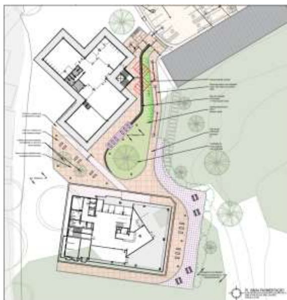
Figura 02 – Planta de situação da biblioteca