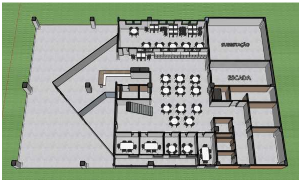
Figura 04 - Modelagem 3D do pavimento térreo

O projeto do pavimento térreo inclui uma sala de leitura, espaços para estudo individual, um salão aberto, uma varanda, recepção, sanitários feminino e masculino, sanitários para PCD, copa, áreas técnicas, DML e uma área destinada aos equipamentos das instalações elétricas da edificação, conforme ilustrado na modelagem 3D do pavimento térreo apresentada na figura 04. Para o acesso ao restante do prédio, há uma escada aberta central, uma escada fechada de emergência e um elevador.